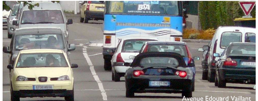
Avenue Edouard Vaillant

La déviation de la circulation à l'ouest d'Hennebont est souhaitable. Mais ce n'est pas la solution miracle tant attendue.